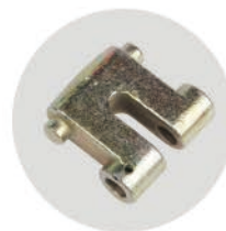
尾环架 End Anchor