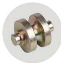
精铸导轮 Casting Guide Wheel