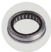
滚针轴承 Roller bearing